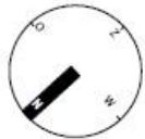
INPLANTING Schaal: 1/600